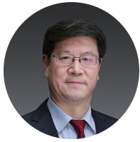
胡 近 教授

上海交通大学博士生导师、曾任上海交大人文社会科学学院院长、国际与公共事务学院党委书记、校党委组织部长、校党委宣传部长、校党委副书记等职务